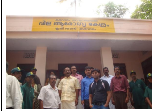
केरालाको काराववरम ग्राम पञ्चायतमा

सहितको स्थानीय सरकार र स्थानीय निकायका संगठनहरू, कर्णाटकको विकेन्द्रीकरण अभियान र बिहारको स्थानीय निकायले अभ्यास गर्दै गरेका अधिकारहरूका बारेमा राम्रो प्रस्तुति गरिएको थियो । त्यस्तै भुटानले महिला निर्वाचित प्रतिनिधिहरूलाई तालिम दिँदै विस्तारै आरक्षण तथा राष्ट्रिय स्तरको संगठन निर्माणको प्रक्रियामा गइरहेको विषय र बंगलादेशमा तेर्सो सिकाई कार्यक्रमका अनुभव र नेपाल र बंगलादेशले सो विषय मिलेर सिकदै अघि बढ्न थालेको र निकट भविष्यमै पुनः बंगलादेशमा संयुक्त सिकाई आदान प्रदान कार्यक्रम गरिन थालेको विषय पनि छलफल गरिएको थियो ।