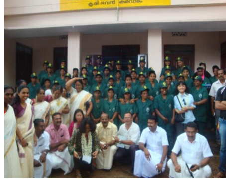
केरालाको कारावाराममा कृषि तालिम गर्ने महिलाहरूसंग