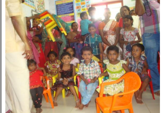
केरालाको कारावाराममा पूर्व प्राथमिक विद्यालय

मुम्बईबाट केराला गई तयहाँको ग्राम पञ्चायत एशोसियशनका पदाधिकारी तथा स्थानीय ग्राम पञ्चायतमा गई प्रत्यक्षतः कार्य सञ्चालन, महिलाका कुटुम्बश्री, बस्तिका समुहहरू, आगनवाडी भनिने वाल विकास केन्द्र वा पूर्व प्राथमिक विद्यालयहरू, शारीरिक र मानसिक हिसावले असक्त विद्यालयहरू, महिलाका आयमूलक कार्यक्रमहरूका उत्पादन इकाईहरू तथा तिनका समुहको कार्यप्रणाली, हालसम्मको लाखौं बचत तथा त्यसको सकारात्मक पंचालन र आय आर्जन बढ्नुका साथै अन्य विकासका सूचकहरूमा पनि वर्षेनी बढ्दै गएका उदाहरणका बारेमा प्रशस्त लाभदायक सिकाईहरू भएका थिए । केरालाको सिकाईपछि सदस्य