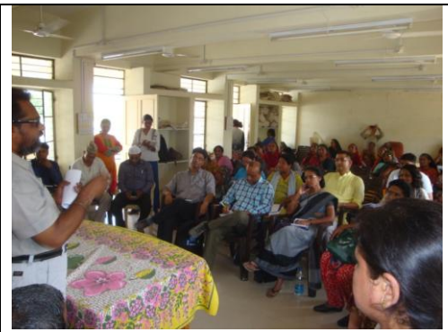
गुजरातको मुन्द्रामा पञ्चायतका अधिकृत कर्मचारीसंग छलफल गर्दै