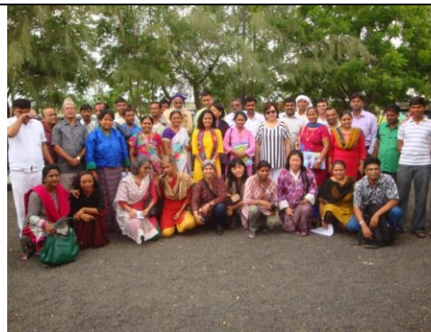
मुन्द्रा ब्लक पञ्चायतमा महिला संगठनसंग सामुहिक तस्वीर