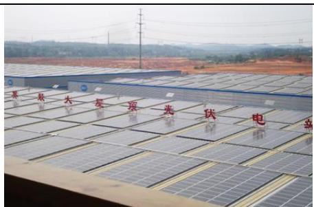
World's Largest Roof Top Solar PVS System