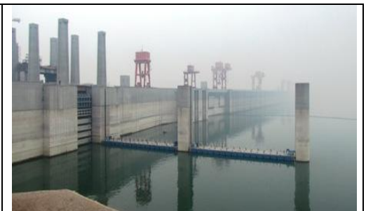
China Yangtze Three Gorges Project