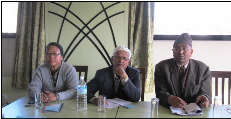
महिन लिम्बु गाविस महासंघ

१३. संघ/महासंघहरूको तल्ला तहका संरचनाहरू समेतबाट व्यापक सहयोग र समर्थन लिन विभिन्न क्रियाकलापहरूको आयोजना गर्ने ।